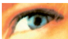
Sealys Cor em Policarbonato em 1200 dpi