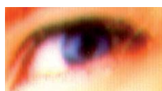
Standard D2T2 no 300 dpi

As soluções de personalização de identidade de policarbonato mais utilizadas produzem apenas imagens em escala de cinza. A solução Sealys - Cor em Policarbonato produz fotos coloridas em alta resolução e extremamente detalhadas que facilitam o reconhecimento das características faciais e tom da pele. A imagem em cores, de até 1200 DPI, permite uma identificação mais precisa nos postos de gerenciamento de fronteiras. Os recursos de segurança reforçada e personalização forte a laser - como o microtexto - tornam praticamente impossível a adulteração da foto colorida. Além do mais, a imagem colorida de alta qualidade é facilmente distinguível de outras tecnologias de cor existentes no mercado hoje em dia.